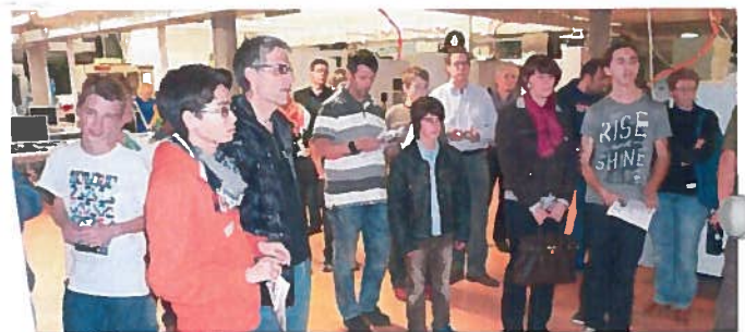
La visite de l'atelier de formation a permis de voir les différentes places d'apprentissage en «live».