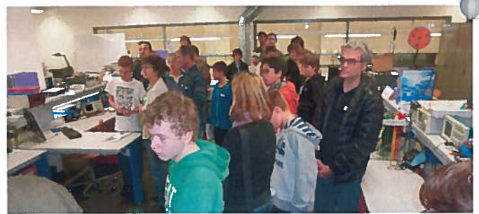
Les jeunes intéressés présentent leur travail à leurs parents.

tion. Notre fils nous a encore longtemps parlé hier soir de cet après-midi et est encore persuadé de vouloir apprendre le métier de polymécanicien ou automatique. Et il est clair qu'il va faire des stages dans ces métiers. J'aimerais profiter de l'occasion pour vous féliciter vous et tous les participants pour cette manifestation réussie. Votre présentation était variée et on sentait votre conviction que le choix d'une formation manuelle est encore toujours le bon choix. Votre comparaison entre la filière de l'apprentissage et le chemin académique était très bonne. Je soutiens également votre concept d'offrir aux jeunes d'abord des informations à l'école obligatoire au commencement de la 8ème année, suivies par la visite des foires professionnelles à travers des workshops puis un premier court stage en entreprise».