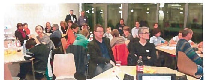
La présentation de la branche MEM et des possibilités de formation pour les jeunes et leurs parents, ainsi que la partie questions/réponses.